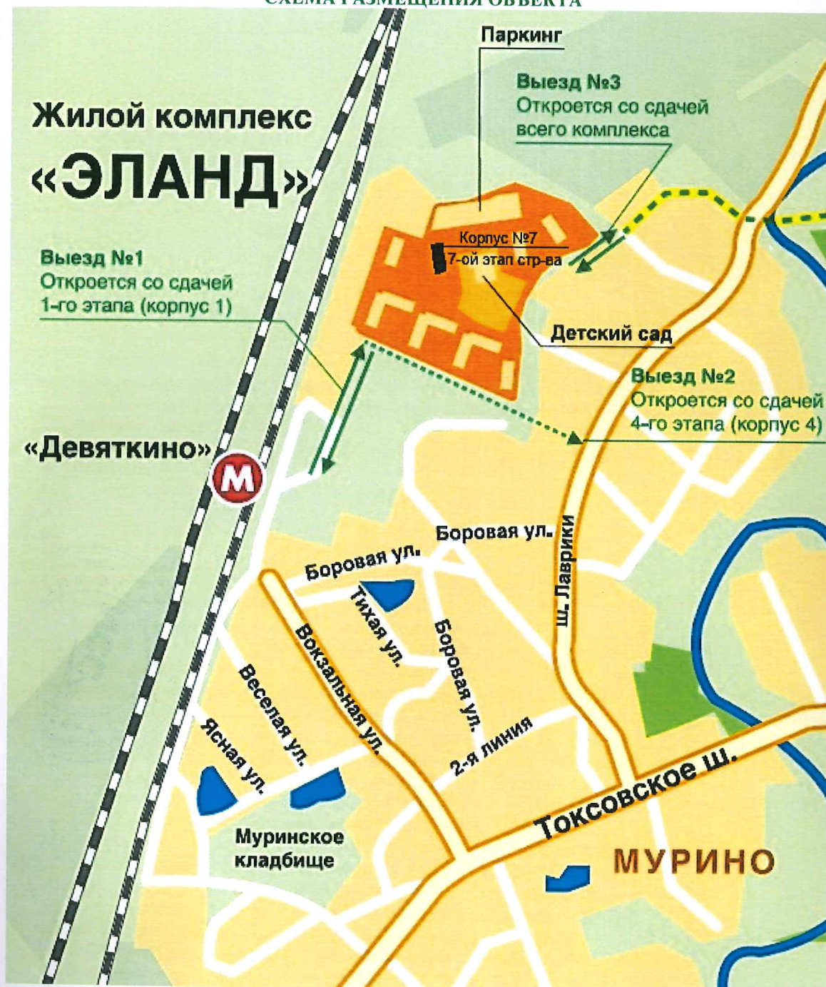
СХЕМА РАЗМЕЩЕНИЯ ОБЪЕКТА